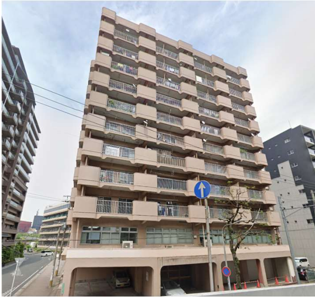
住環境が魅力な立地