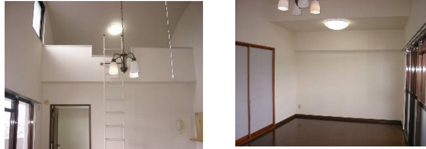
南向きのバルコニーで日当たり良好♪